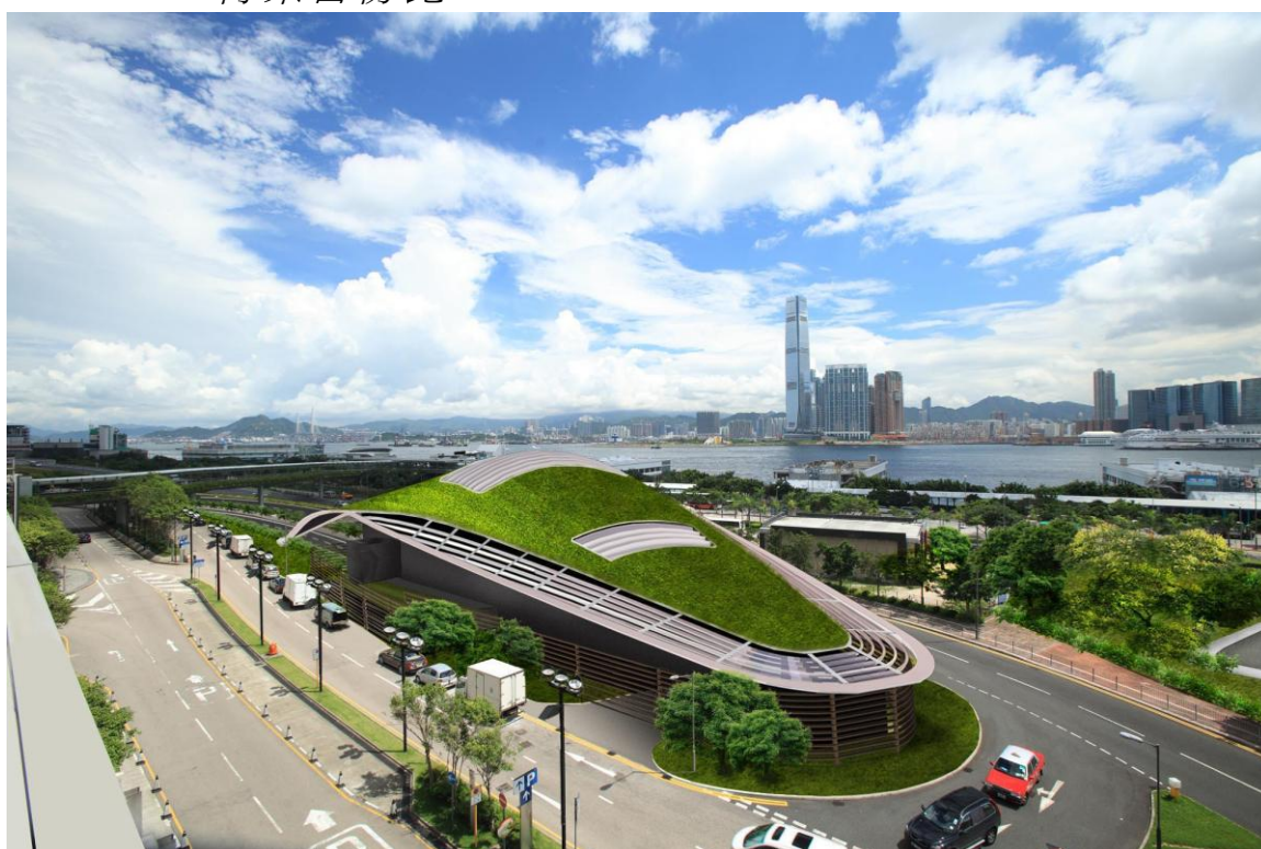
圖一 外觀設計一：以「流線型屋頂草坪」為主題