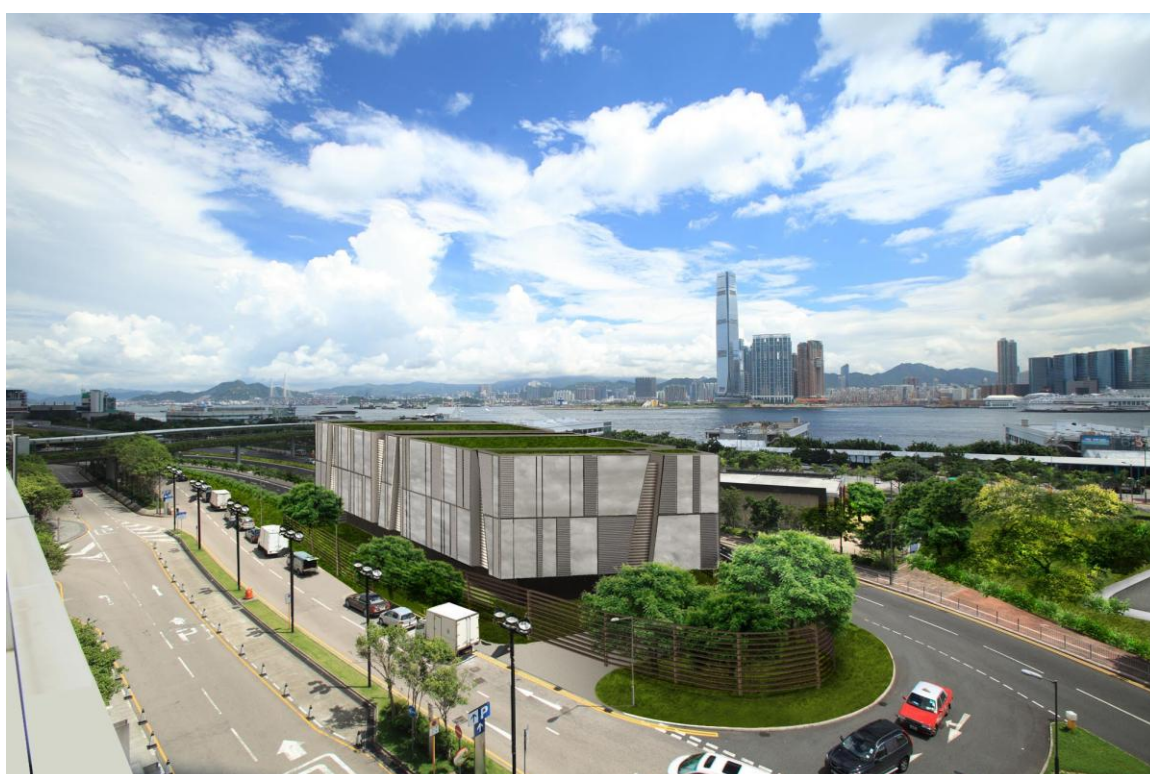
圖二 外觀設計二：以「不規則立體及抽象蝕刻」為主題